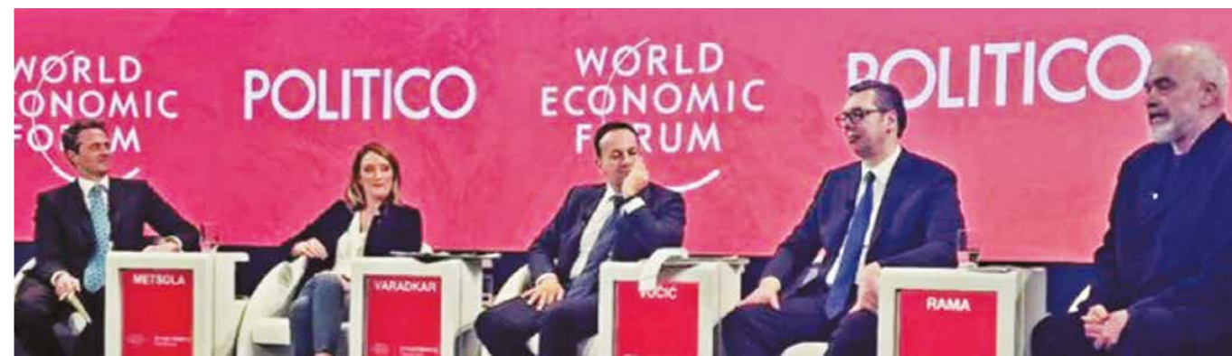
ПРЕДСЕДНИК ВУЧИЋ УЧЕСТВОВАО ЈЕ НА ПАНЕЛУ „ШИРЕЊЕ ХОРИЗОНАТА ЕВРОПЕ“