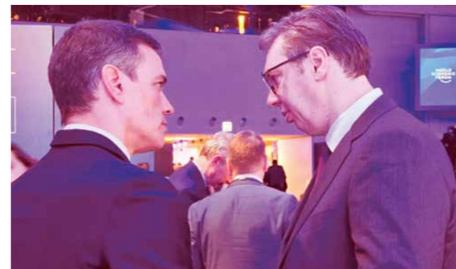
... СА ПРЕДСЕДНИКОМ ВЛАДЕ ШПАНИЈЕ ПЕДРОМ САНЧЕЗОМ