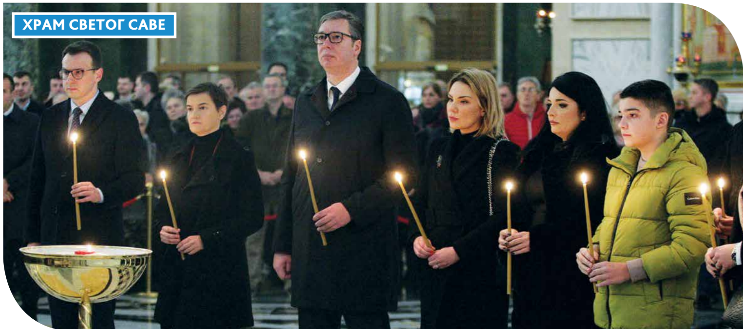
ПОМЕН ПОВОДОМ ПЕТ ГОДИНА ОД УБИСТВА ОЛИВЕРА ИВАНОВИЋА, ЛИДЕРА ГРАЂАНСКЕ ИНИЦИЈАТИВЕ „СРБИЈА, ДЕМОКРАТИЈА И ПРАВДА”