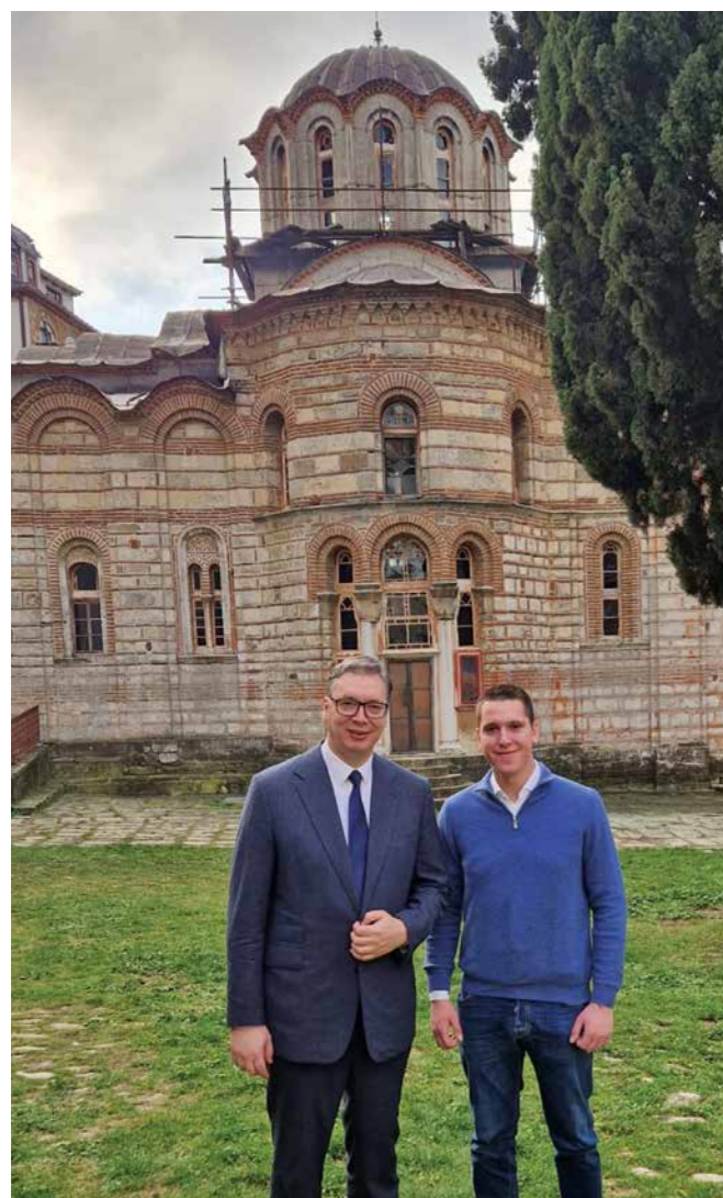
АЛЕКСАНДАР И ДАНИЛО ВУЧИЋ ИСПРЕД ВЕЛИКЕ СРПСКЕ СВЕТИЊЕ