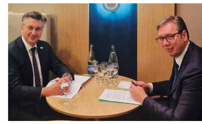
... СА ПРЕДСЕДНИКОМ ВЛАДЕ ХРВАТСКЕ АНДРЕЈЕМ ПЛЕНКОВИЋЕМ

„Америка и Кина контролишу највећи део производње батерија за електрична возила у свету, и сад Европа мора да проналази своје ресурсе. Она је веома снажна, али плашим се да неће лако моћи да прати ове две највеће економске