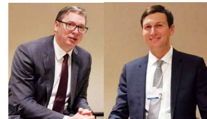
... СА ОСНИВАЧЕМ И ИЗВРШНИМ ДИРЕКТОРОМ КОМПАНИЈЕ „АФИНТИ ПАРТНЕРС“ ЦАРЕДОМ КУШНЕРОМ

Председник Србије Александар Вучић присуствовао је годишњем састанку Светског економског форума у швајцарском Давосу, где је разговарао са бројним светским лидерима и представницима финансијских и политичких институција. Са лидерима региона састао се на панелу „Дипломатски дијалог на Западном Балкану“, а учествовао је и на панелу „Како нова Европска политичка заједница може да ојача безбедносни пејзаж континента услед широк геополитичких промена?“.