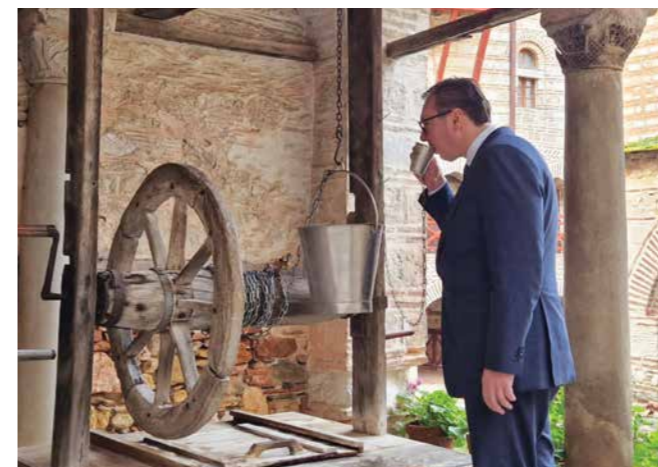
ЧАША ВОДЕ СА БУНАРА СВЕТОГ САВЕ