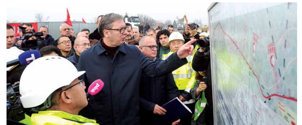
ПРЕДСЕДНИК АЛЕКСАНДАР ВУЧИЋ СА МИНИСТРОМ ГОРАНОМ ВЕСИЋЕМ И ИЗВОЂАЧИМА РАДОВА

Истакао је да је то веома важно због развоја севера земље и развоја туризма на Палићу и Тополи, али и даљег развоја Врбаса, Ловћенца и других места која се налазе уз трасу пруге. Навео је да су све пруге у Србији изграђене између 1884. и 1976. године, када је изграђена последња пруга Београд-Бар.