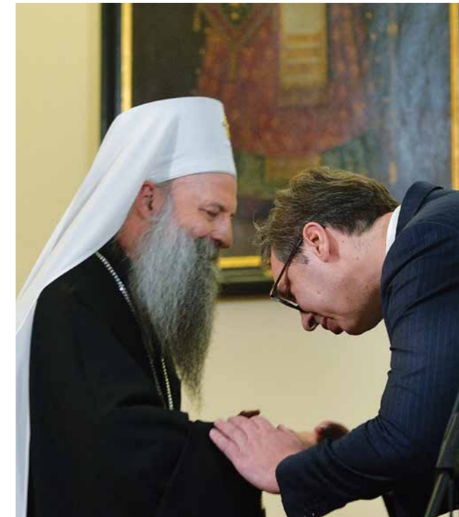
ПАТРИЈАРХ СРПСКИ ПОРФИРИЈЕ И ПРЕДСЕДНИК СРБИЈЕ АЛЕКСАНДАР ВУЧИЋ

Апеловао је, како је рекао, на све који сигурно могу да утичу на Приштину и доносе одлуке, па и одлуку да се забрани патријарху СПЦ без икаквог разлога да оде својој