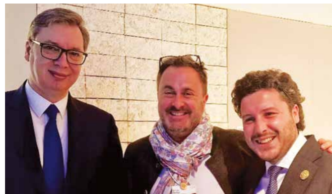
... СА ПРЕМИЈЕРОМ ЛУКСЕМБУРГА ГЗАВИЈЕОМ БЕТЕЛОМ И ПРЕМИЈЕРОМ ЦРНЕ ГОРЕ ДРИТАНОМ АБАЗОВИЋЕМ