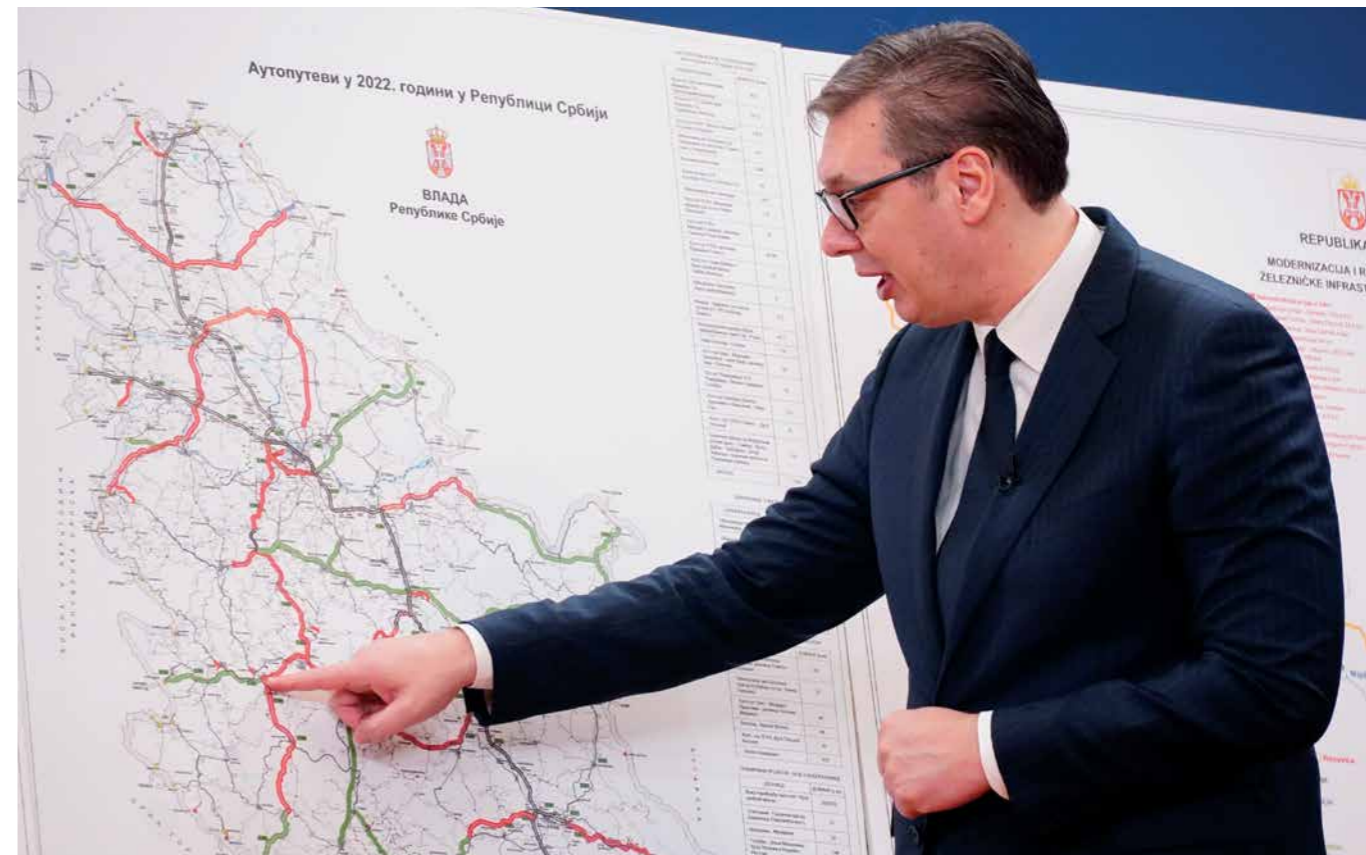
УБРЗАНО ПРЕМРЕЖАВАЊЕ СРБИЈЕ НАЈМОДЕРНИЈИМ ПУТЕВИМА И ПРУГАМА

Он је објаснио да ће 2023. година бити година даљег развоја и напретка, упркос свему, као и раста плата и пензија. Истакао је да је и енергетска стабилност важна и да, заједно са Норвежанима, радишно на њој. Такође, открио