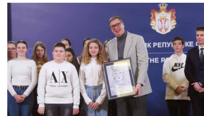
СА ДЕЦОМ СРПСКЕ НАЦИОНАЛНОСТИ ИЗ СЛОВЕНИЈЕ

На Бадњи дан, председник Србије Александар Вучић примио је децу српске националности из Словеније, која бораве у посети Београду поводом Божићних празника. Председник им се обратио стиховима Јове Јовановића Змаја, те нагласио да одакле год су им родитељи дошли у Словенију, никад нису заборавили Србију, нити су се икад стидели свог српског имена и презимена.