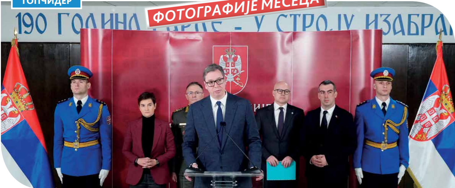
ПОСЛЕ САСТАНКА У ДОМУ ГАРДЕ ВОЈСКЕ СРБИЈЕ, ГДЕ СУ ПРЕДСТАВЉЕНИ РЕЗУЛТАТИ АНАЛИЗЕ СТАЊА, ОПЕРАТИВНИХ И ФУНКЦИОНАЛНИХ СПОСОБНОСТИ ВОЈСКЕ ЗА 2022. ГОДИНУ