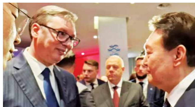
ПРЕДСЕДНИК СРБИЈЕ АЛЕКСАНДАР ВУЧИЋ САСТАО СЕ НА МАРГИНАМА СВЕТСКОГ ЕКОНОМСКОГ ФОРУМА СА ПРЕДСЕДНИКОМ КОРЕЈЕ ЈУНОМ СУК-ЈОЛОМ