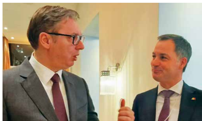
... СА ПРЕМИЈЕРОМ БЕЛГИЈЕ АЛЕКСАНДРОМ ДЕ КРООМ