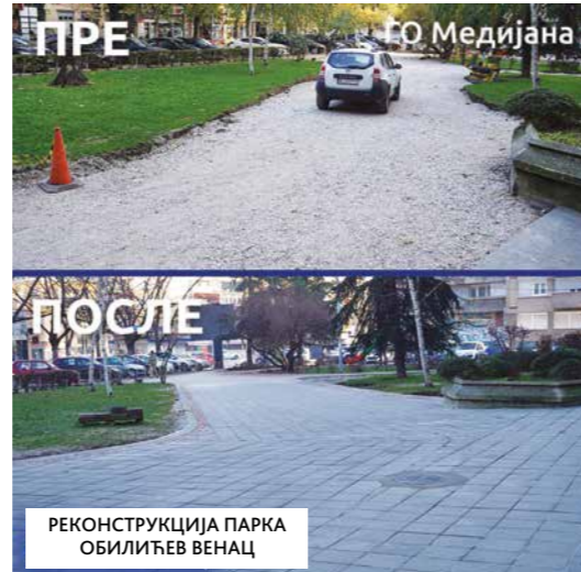
РЕКОНСТРУКЦИЈА ПАРКА ОБИЛИЋЕВ ВЕНАЦ

дором Кристофером Хилом, отворила проширени део Центра за пружање услуга из области социјалне заштите „Мара“, којим је та установа добила још две услуге: персоналног асистента и личне пратиоце особа са инвалидитетом. Град Ниш изабрао је најбоље спортисте и наградио најуспешније компаније.