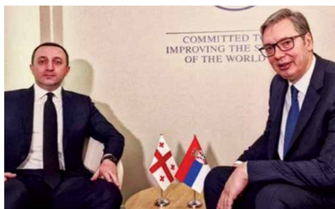
... СА ПРЕДСЕДНИКОМ ВЛАДЕ ГРУЗИЈЕ ИРАКЛИЈЕМ ГАРИБАШВИЛИЈЕМ

Током боравка у Давосу, председник Вучић рекао је да је тај скуп постао клуб истомисљеника - и по питању руско-украјинске кризе, и по питању КиМ, где, како каже, нико не жели да чује ни шта каже међународно право, ни какве резолуције постоје. Наглашава да у региону, посебно у Северној Македонији и Србији, постоји пад ентузијазма за улазак у ЕУ, пре свега због политичких захтева који долазе, а тичу се или