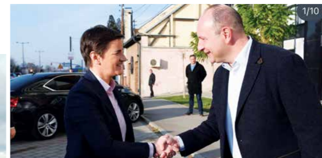
ПРЕМИЈЕРКА БРНАБИЋ И ГРАДОНАЧЕЛНИК ЂУРИЋ

Ово је друга година како локална самоуправа, у сарадњи са Црвеним крстом, спроводи поделу новогодишњих пакетића у свим местима, уз позоришну представу. У организацији Општинске народне библиотеке, одржана је четвр-