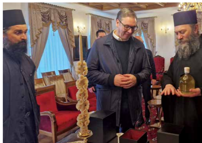
ПРЕДСЕДНИКА СРБИЈЕ ДОЧЕКАЛИ СУ МОНАСИ МАНАСТИРА ХИЛАНДАР