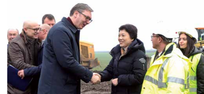
СРДАЧАН СУСРЕТ НА ГРАДИЛИШТУ СА АМБАСАДОРКОМ КИНЕ ЧЕН БО

„Између 1976. и 2012, дакле 36 година, нисмо подигли ни једну пругу, а реконструисали смо у том периоду 31 километар. За ових 10 година изградил смо 108,1 километара нових савремених пруга, реконструисали 781,5 километара пруге и сада очекујемо да завршимо нових 156 километара, а у плану имамо преко 2.026 километара